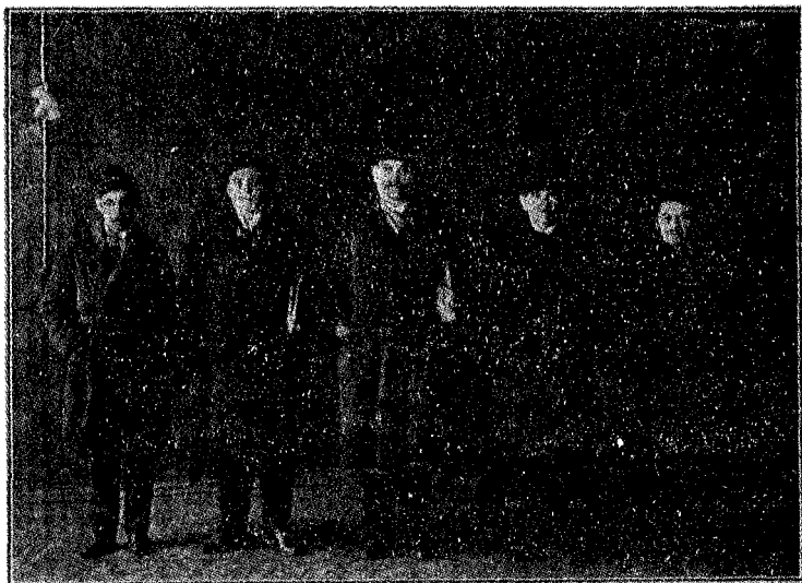
И.С.Проханов и его ближайшие соратники в Ленинграде (к стр. 143).