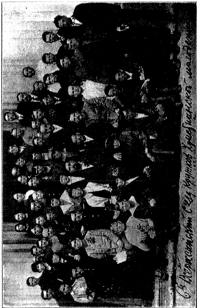
Шестая конференция молодежи Евангельских христиан в Твери. Все изображенные на снимке были арестованы и посажены в тюрьму (см. противоположную страницу).