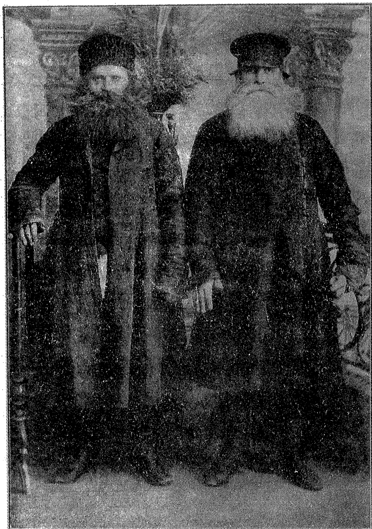
Типичные молоканские старейшины (к стр. 24).