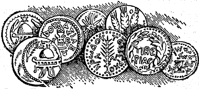
Рисунок Горация Ноулса из Британского и иностранного библейского общества.

Правильно поставленная церковная дисциплина признается в небесном суде. Дав наставления, как надо действовать, и указав, что в некоторых случаях надо прибегать к отлучению, Иисус сказал: "Истинно говорю вам: что вы свяжете на земле, то будет связано на небе; и что разрешите на земле, то будет разрешено на небе" (Мтф. 18:18).