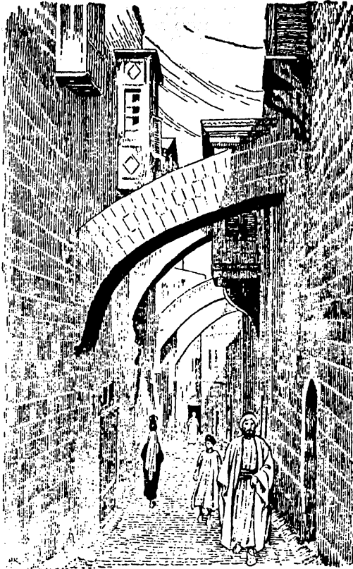
"Улица в Иерусалиме"

Следующая диаграмма: "Различные аспекты деятельности Святого Духа" должна помочь наглядно представить то, о чем идет речь в этом дополнительном исследовании.